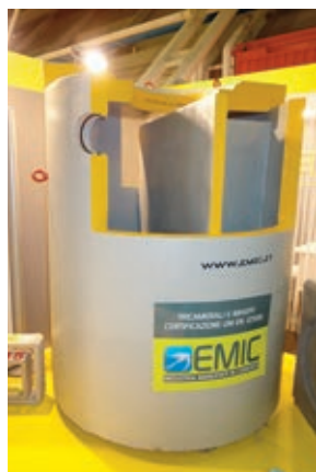
FOSSA SETTICA TRICAMERALE MONOLITICA SEZIONATA (vedi pag. 97)

SCHEDA TECNICA E CALCOLI DI DIMENSIONAMENTO FORNITI SU RICHIESTA.